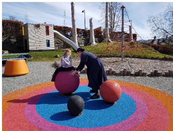
Sætreparken er en attraktiv park, møte- og lekeplass.

Årets innbyggerundersøkelse viser en økning i andel som helt eller delvis opplever at Ytre Arna som et trygt sted å vokse opp (fra 64% til 72%), og andelen som er enig eller delvis enig i at Ytre Arna er et attraktivt sted å bo er økt fra 56% i 2014 til 66% i 2019.