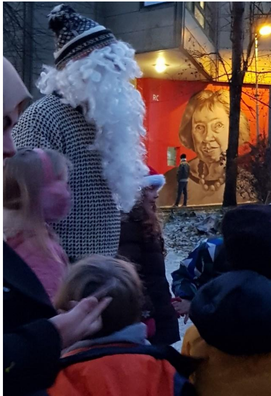
På vei til julegrantenning i Solheimsgaten.

Løvstakken, og de som bor på nedsiden mot fjorden. Gaten er heller ikke noen hyggelig skolevei for de barna som er flyttet til Damsgård og som skal gå på Ny-Krohnborg skole.