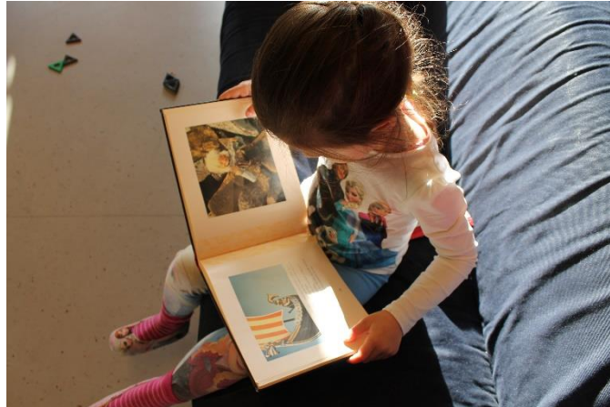
Tidlig innsats for språkutvikling er viktig. Lesefrø bidrar til gode lesevaner og leseaktiviteter for alle barn i barnehagen. Bøkene finnes på mange ulike språk.