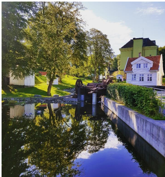
Nydelige Håsteinarparken.

I perioden har Håsteinarparkens trinn 1 og 2 blitt gjennomført, og Laksevågparken er oppgradert. Det er etablert en rekke barnas byrom, og Bergens første parkouranlegg er etablert ved Laksevåg senteret. Anlegget er et godt eksempel på hvordan unge har, og kan medvirke i etableringen av møteplasser og fellesrom. Andre eksempler er etablering av Fysak og Bua (gratis utlån av sports- og fritidsutstyr). Her nyttes også utearealene, med blant annet etablert klatrevegg. Av innendørs møteplasser vil vi trekke frem etablering av Gnisten, som rommer både kontorer og felles - og møterom. Damsgård skole har også fått ekstra arealer til nærmiljøaktiviteter, og det er etablert koordinator som forvalter kultur og idrettsarealene.