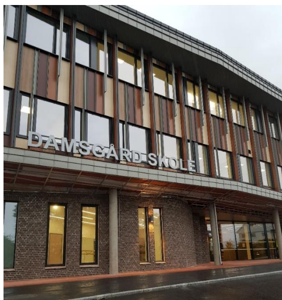
Damsgård skole. Nytt skolebygg stod klart til skolestart i 2018.

I de årene områdesatsing har pågått, har kommunen realisert en rekke investeringsprosjekter i de aktuelle levekårssonene, som i all hovedsak er finansiert av kommunens egne investeringsmidler. I Solheim nord kan vi nevne etableringen av Ny-Krohnborgsenteret, Løvtien, Utbedring av Solheimsgaten, 3 Barnas byrom og plan for oppstramming av gatelegemer, belysning og skilting. I indre Laksevåg kan vi nevne Damsgård skole, Holen skole, Håsteinarparken, Laksevågparken, Fysak og en rekke byrom som er kommet på plass. Det er også etablert et eget hus for kulturkontoret og møtelokaler for lag og organisasjoner, Gnisten, og nytt bibliotek er nå under etablering. I Ytre Arna har Bergen kommune bygget Sætreparken og det er ny skole under planlegging. På Slettebakken ble det gjennomført et omfattende bomiljøprosjekt som inkluderte bolig-opprustning og etablering av Femmeren, et sambruks og beboerhus. Prosjektet ble avsluttet i 2015/2016. Dette arbeidet ble også i hovedsak finansiert av kommunens egne budsjetter, men i en periode ble det også gitt statlige områdesatsingsmidler til arbeid på Slettebakken, jfr. tabellen over.