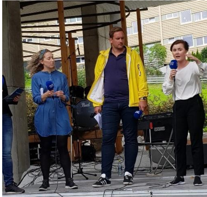
Politisk halvtime i forbindelse med gjennomføring av Løvestakkdagene 2019.