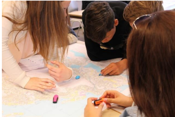
Barnetråkk - barn og unge gir verdifulle innspill til hva som er viktig i deres nærmiljø.

tilstedeværelse i lokalmiljøet, der en har dialog og samtaler, samarbeidsgrupper og årlige folkemøter. Det avholdes folkemøter i hvert satsingsområde, der en eller flere byråder deltar. Folkemøte er en arena som bidrar til å bygge bro mellom lokalbefolkningen, kommunen og politikerne. I disse møtene blir det gitt fylldig informasjon om området, og byrådene kan besvare relevante spørsmål.