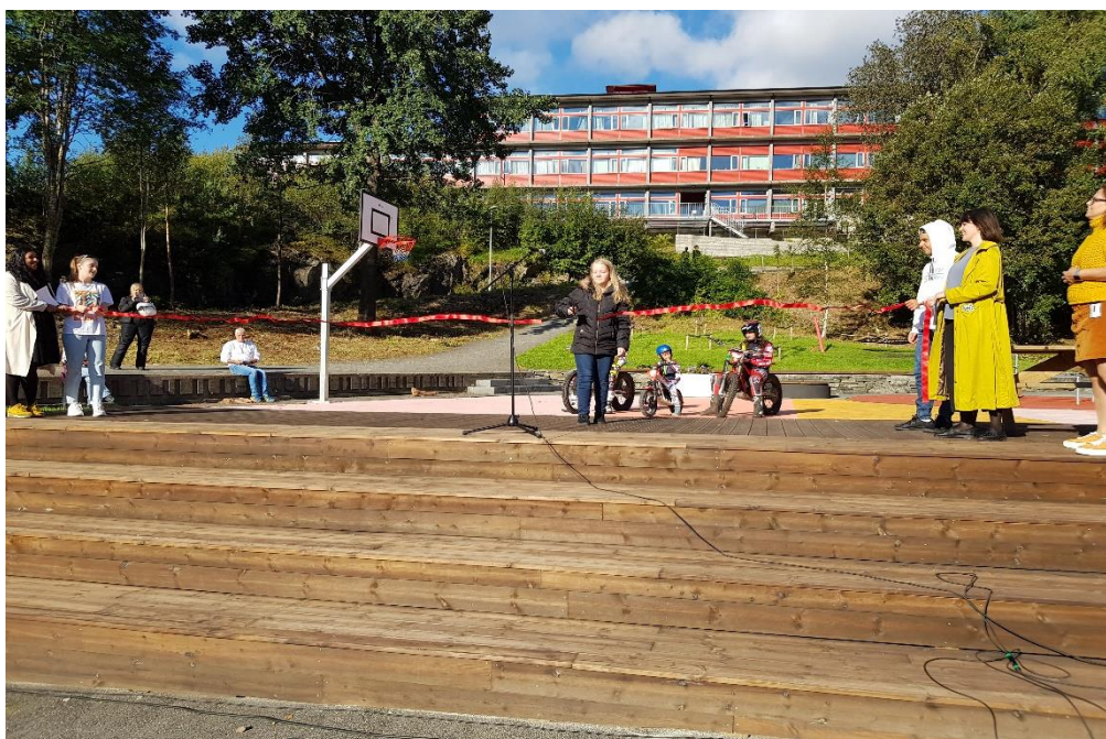
Her er det åpning for det nye uteområdet ved Elvetun Ungdomshus i Loddefjord. Elevrådsrepresentanter fra de lokale skolene åpner uteområdet sammen med to byråder.

Bystyret vedtok i sak 157/17 at det skulle startes opp forprosjekt for områdesatsing i Loddefjord og Olsvik i 2018. De to områdene ble prioriterte på grunn av høye andeler unge med grunnskole som høyeste utdanning, høy andel unge uføre og arbeidsledige, samt mange tilfeller av barnevernssaker. I byrådssak 1231/19 vedtok byrådet å starte opp områdesatsing i Loddefjord og Olsvik i samarbeid med Kommunal- og moderniseringsdepartementet (KMD) med varighet frem til 2026. Dette samarbeidet er utviklet etter modell fra nye områdesatsinger i Oslo og Stavanger (se vedlegg).