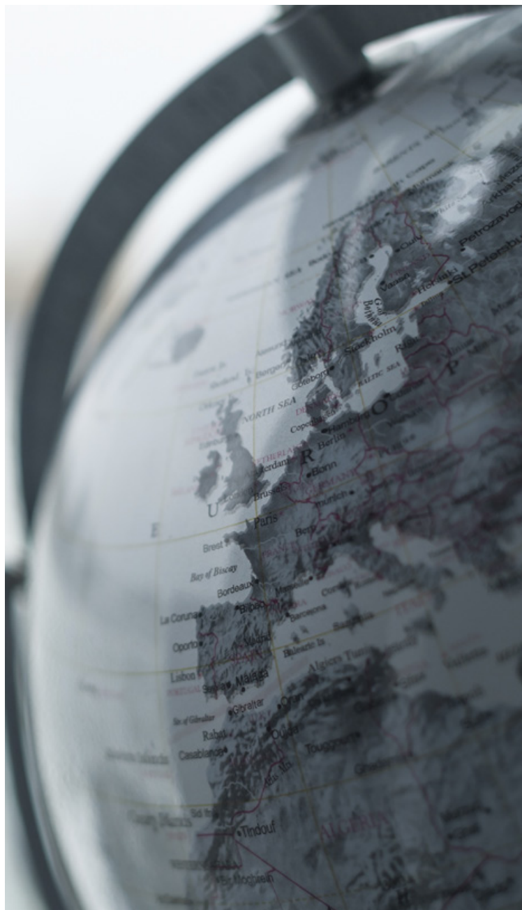
Deltakelse i EU-prosjekt og andre internasjonale prosjektsamarbeid bidrar til utvikling av kommunens tjenester.

Internasjonalisering kan ta mange former og omfatter et mangfold av aktiviteter og finansieringskilder. Samtidig kan søknadsskriving og rapportering oppleves som svært krevende. Rammene, omfanget og ambisjonene for de ulike aktivitetene og prosjektene kan variere. Uansett krever prosjektdeltakelse menneskelige ressurser, egenandel og kunnskap om prosesser. Sikring og kobling av tilstrekkelig kompetanse og ressurser blir derfor viktig i oppfølgingen av strategien.