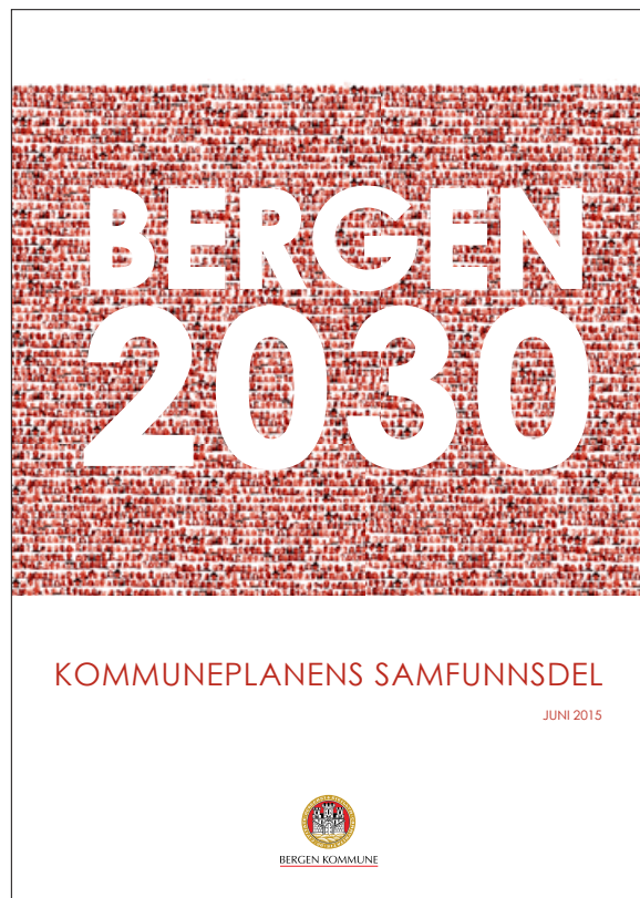
Bergen 2030 Kommuneplanens samfunnsdel

Internasjonal strategi må sees i sammenheng med øvrige planer i Bergen kommune, som f.eks. Grønn strategi, plan for inkludering og mangfold, folkehelseplan, strategisk næringsplan, plan for områdesatsing, kulturstrategi for Bergen kommune, mv.