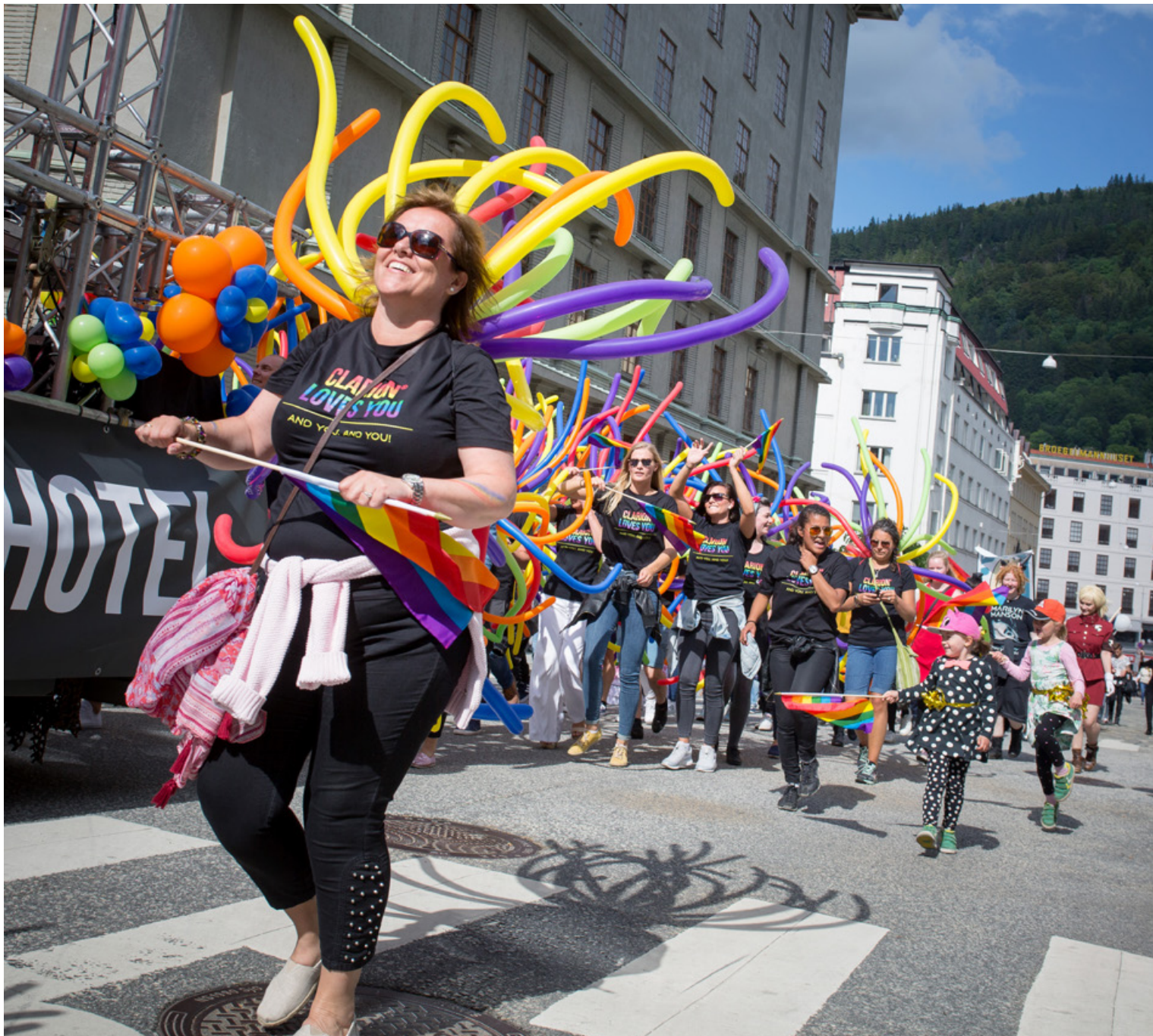
Pride-paraden er høydepunktet under Regnbuedagene hver sommer.