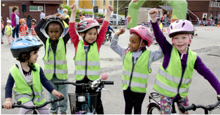
Den store barnesykkeldagen: Barn fra Solheimslie barnehage jubler etter en herlig dag på sykkel.