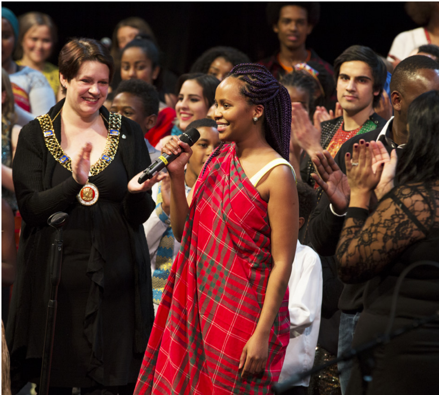
I Fargespill samles barn og ungdom fra hele verden gjennom musikk og dans. I 2015 fikk kompaniet Bergen kommunes pris for likestilling, inkludering og mangfold fra ordfører Marte Mjøs Persen.