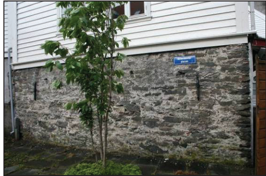
Figur 6. Steinkjeller over bakkenivå i Øvre Korskirkesmau.

Tiltak: Byantikvaren ønsker å iverksette et prosjekt med sikte på å kartlegge og dokumentere Bergens steinkjellere og presentere dette i form av et kulturminnegrunnlag, og med forskjellig publikumsrettet informasjonsmateriell. Gjennomføring av et slikt prosjekt er avhengig av ekstra bevilgninger.