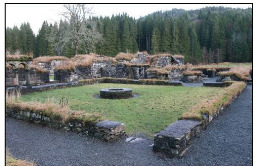
Figur 2. Lyse klosteruin i Os kommune.

Byantikvaren ser på arbeidet med bevaring og formidling av Bergens middelalderruiner som en av flere kjerneoppgaver og ønsker å videreføre innsatsen i årene som kommer. Det jobbes med flere konkrete prosjekter, mens andre er under planlegging. Prosjektene tar delvis sikte på finansiering gjennom bevilgninger fra Riksantikvaren og delvis gjennom egenandeler fra Bergen kommune og private eiere.