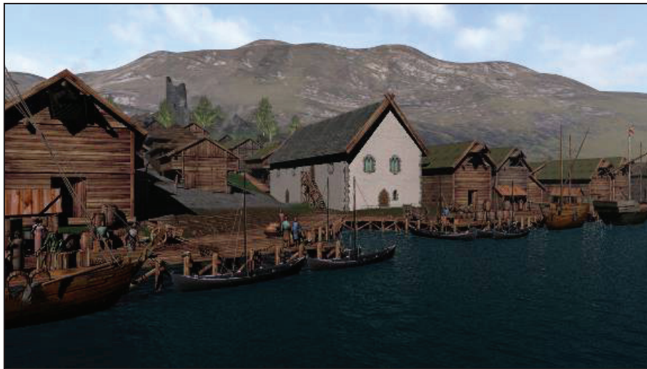
Figur 4. Digital rekonstruksjon av Bryggen i Bergen og rådhuset ca 1350 (Illustrasjon: Arkikon 2010).

Byantikvaren gir informasjon og gjennomfører på forespørsel forelesninger og byvandringar som tar for seg byens middelalderruiner for publikum. Denne typen formidling er etterspurt av det private næringsliv, historiske foreninger, forvaltning, presse, skoler, universitet og historisk fagmiljø.