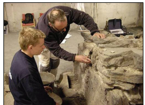
Figur 1. Konserveringsarbeid i Rådhus-/vinkjellerruinen (foto: Byantikvaren).

Kompetanse innen tilstandsvurdering, sikring og konservering av middelalderruiner er et forholdsvis smalt felt som etterspurt i Norge. At Bergen kommune selv innehar denne kompetansen gjør den i stand til å forvalte ruinene i kommunens eie på en forsvarlig og mer kostnadseffektiv