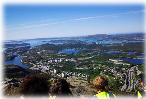
Utsikt over Loddefjord, fra toppen av Lyderhorn.

På høsten vil dere også bli invitert til den første utviklingssamtalen med kontaktlærer. Her kan du som forelder komme med tanker og vurderinger om ditt barn, skolestarten og hvordan overgangen fra barnehagen har fungert. Vi ønsker å ha et godt samarbeid med dere foresatte og er veldig glad i å få gode innspill slik at vi kan møte barna på best mulig måte. Sammen gir vi barna en god skolegang med mye god og viktig læring, både sosialt og faglig.