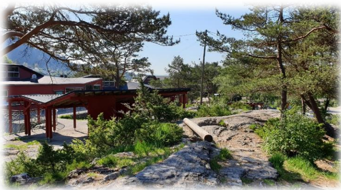
Noe av uteområdet vårt.