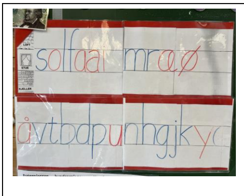
Bokstaver skrevet i bokstavhus.

På 1.trinn handler det mye om å bli kjent med skolen og om hvordan det er å være elev. Vi jobber masse med å bli gode venner og for at alle barna skal oppleve at det er trygt og godt å gå på Loddefjord skole. I tillegg skal vi selvfølgelig øve på å lese, skrive, regne og mye annet spennende. Det blir også god tid til lek, sang og moro.