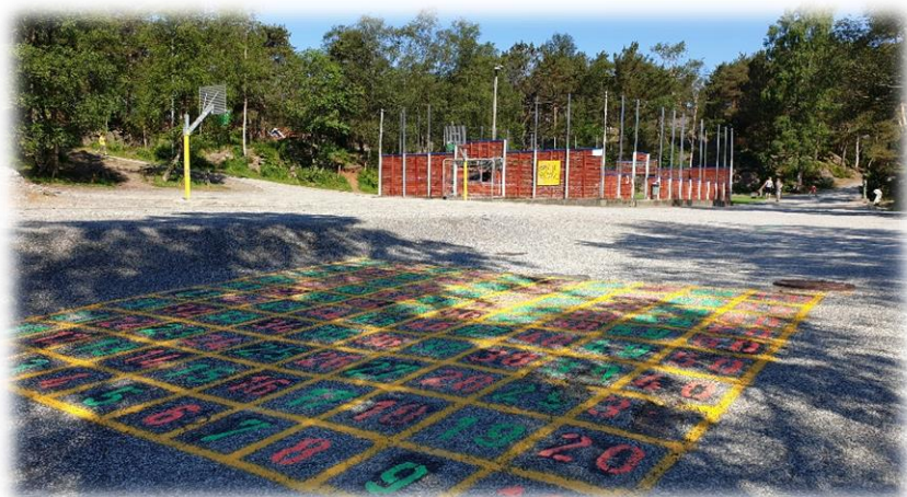
Paradis, 100-rute, basketbane og ballbingen.