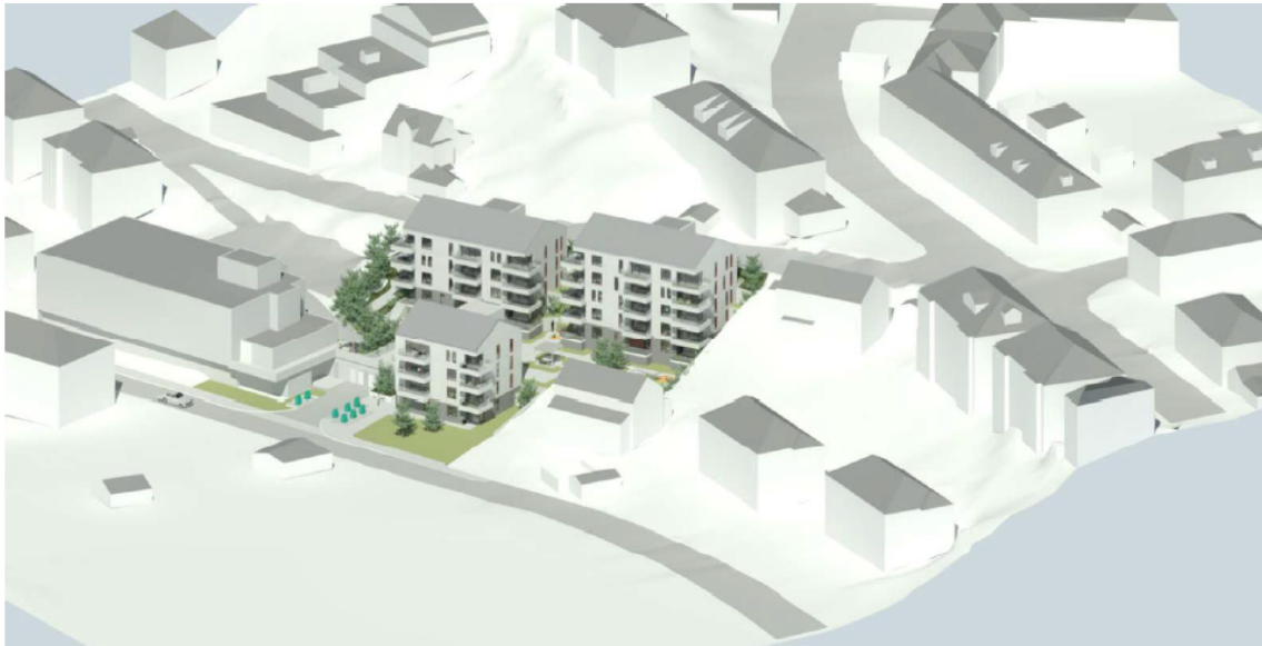
Figur 3: Perspektiv som viser hovudinnhaldet i planforslaget.