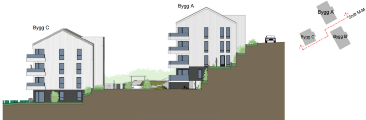
Figur 4: Snitt M-M datert 23.09.2024 som viser det aktuelle arealet mellom bygg A og B.

gonger på eit mindre areal. PBE vurderer at området mellom bygg A og B (sjå figur 4) bør sikrast ein bruksverdi for å unngå ein sjaktkjensle på dette arealet.