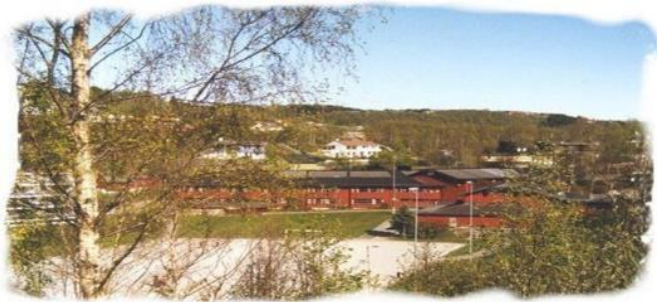
Nysgjerrige og reflekterte barn gir kompetanse for framtiden