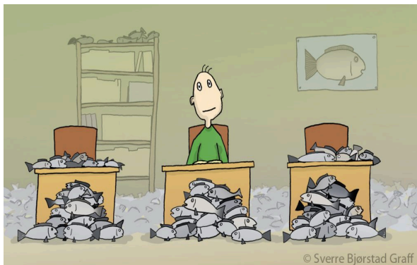
Klasse 8A er ei klasse for sei

Leksetid: Måndag kl. 14.10-15.10 på Mediateket.